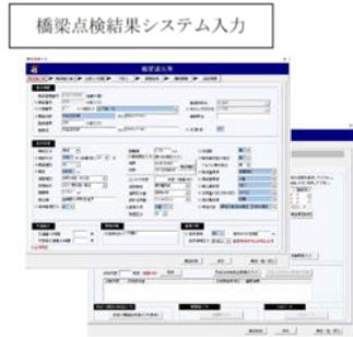
橋梁点検結果システム入力