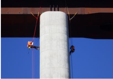
ロープアクセスによる点検