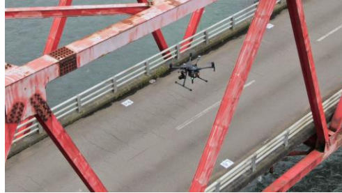
ドローンによる点検補足調査