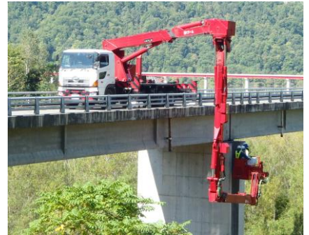
点検車による点検