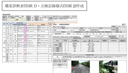
橋梁診断表(別紙1)・点検記録様式(別紙2)作成