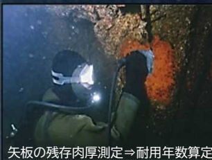
矢板の残存肉厚測定⇒耐用年数算定