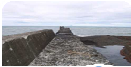
外的要因(中性化・塩害・アルカリ骨材反応・凍結融解等)による劣化の進行