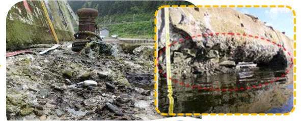
コンクリートの剥離・剥落進行による構造物としての耐力(安定性)の低下