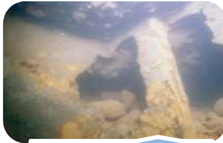
鋼材の腐食・矢板孔食による内部土砂の流出