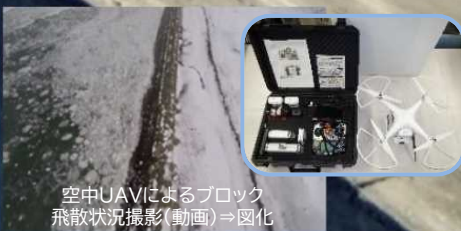
空中UAVによるブロック 飛散状況撮影(動画)⇒図化