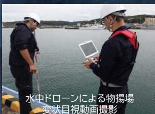
水中ドローンによる物揚場 変状目視動画撮影