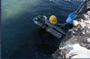
コンクリートコアの採取⇒分析試験