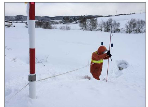
積雪横断観測状況