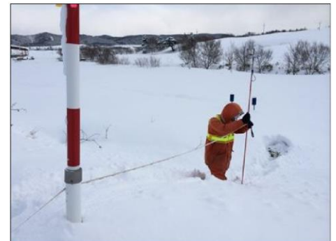
積雪横断観測状況