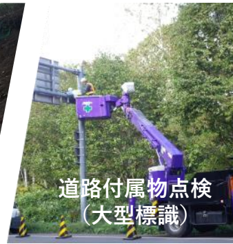
道路付属物点検 (大型標識)