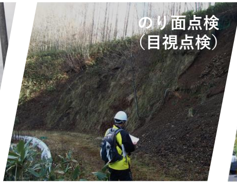
のり面点検 (目視点検)