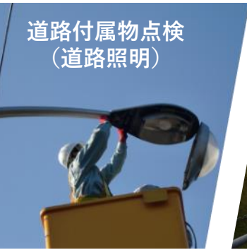
道路付属物点検 (道路照明)