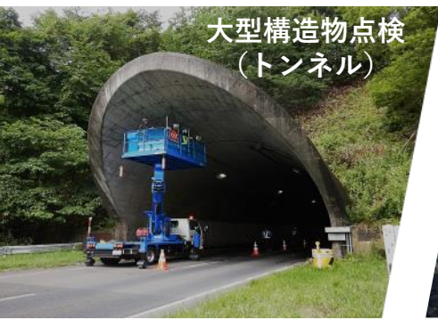
大型構造物点検 (トンネル)